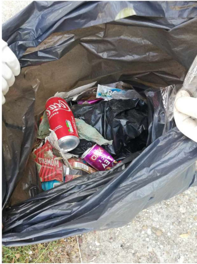
A 11-12.KSI/ C. zsákja hamar megtelt.

Egy nap, amely megmozgatta az egész Szakiskolát. Szeptember 14-én reggeltől minden osztály kivette a részét a szemétszedésből. Vidáman, feladatunk teljes tudatában végeztük a munkánkat.