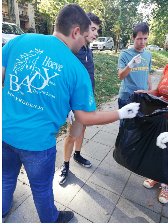
Az osztály apraja-nagyja szorgoskodott.